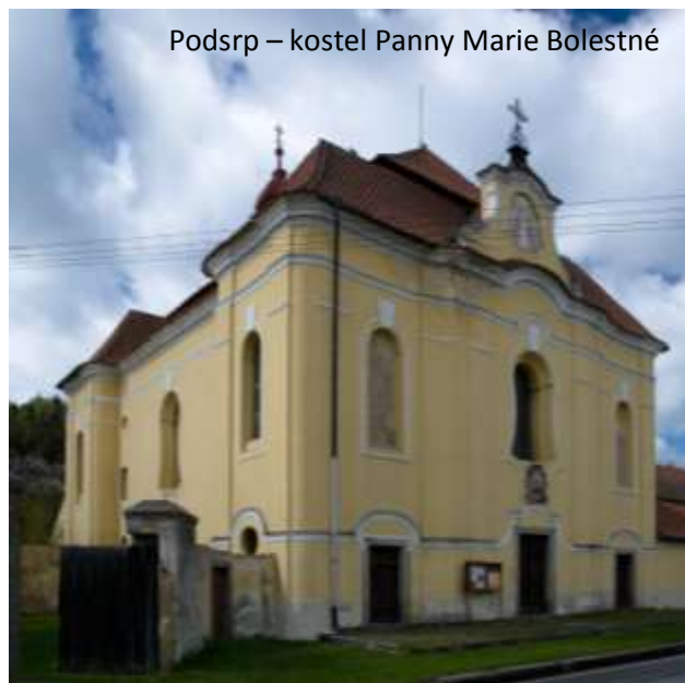
Podsrp – kostel Panny Marie Bolestné

14.00 – 17.00 Lomec, mariánské poutní místo, prohlídka kostela Jména Panny Marie a kláštera. Možnost kratší vycházky.