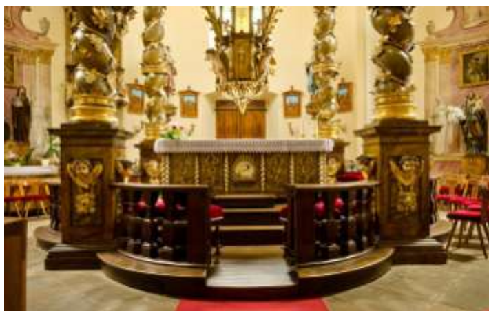
Lomec – kostel Panny Marie